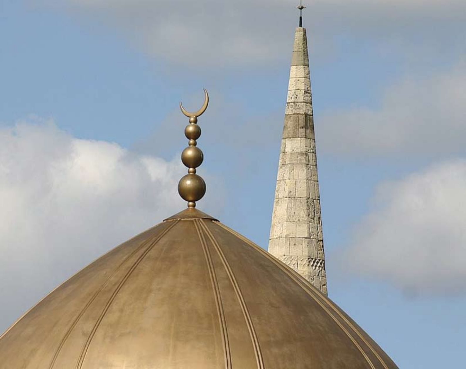
LOA BIRMINGHAMISSA ENGLANNISSA.