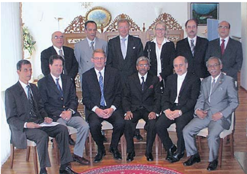
PÄÄMINISTERI VANHANEN JA ISLAMILAISTEN MAIDEN EDUSTAJAT.