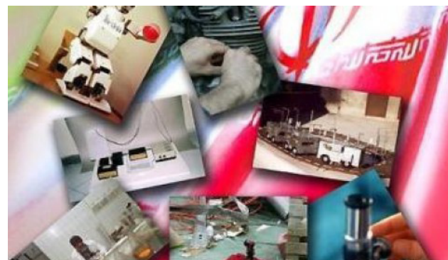
Иран в авангарде возрождения исламской цивилизации стр. 8-9