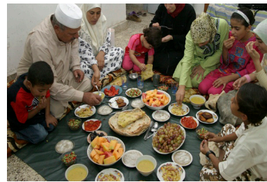
Культура пове- дения за сто- лом, отражен- ная в хадисах стр. 12