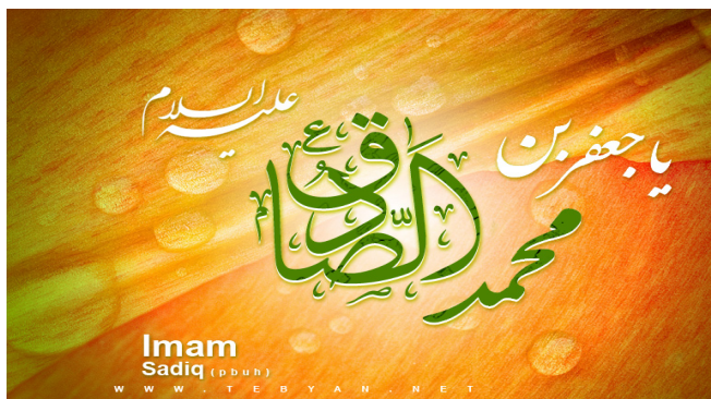
Поучительное наставление от имама Садыка (а) стр. 6-7