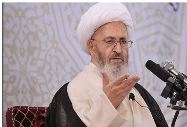
Аятолла Субхани доказывает стр. 9