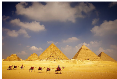
Асийа (жена Фараона) стр.11