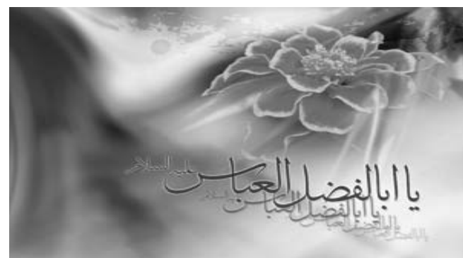
Абульфазл - немеркнущая звезда в караване Хусейна стр. 4

Редакция газеты «Каусар» объявляет новый конкурс на лучшее написание статьи и стихотворения, посвященных Дню рождения имама Махди (а). Победителю будет вручен ценный приз, а отобранное стихотворение или статья будут опубликованы в нашей газете. Просьба отправлять свои работы до 15 июля 2011 г. только по электронному адресу causar-np@mail.ru с точным указанием данных, адреса и номера телефона автора.