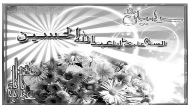
День рождения имама Хусейна (а) – торжество человечности стр. 2