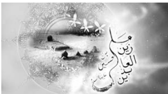
Посвящается благословенному дню рождения четвертого имама стр. 3