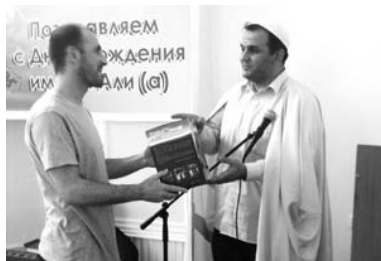
День рождения имама Али(а) стр. 12