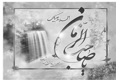
Справедли- вость стр. 7