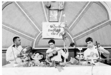
190 лет Гумри стр. 12